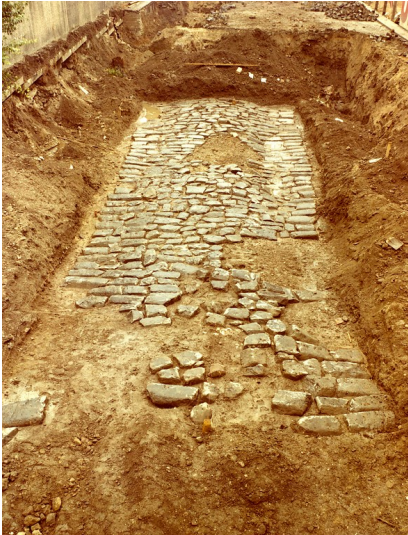
Römische Hafenstraße in ihrem Urzustand (1960er/1970er Jahre)