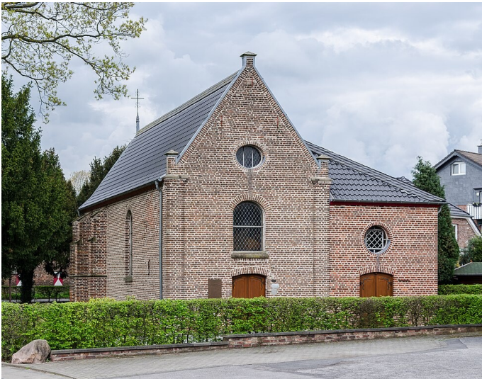
Die Schlosskapelle am früheren Herrenhaus und heutigem Schloss Ossenberg (2018).