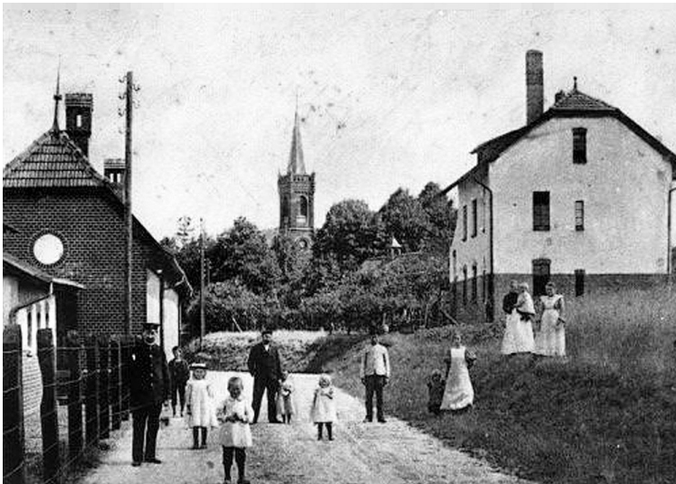
Undatiertes Foto des Bereichs hinter dem Bahnhof Bönninghardt, im Hintergrund die Kirche (vermutlich 1930er bis 1940er Jahre).