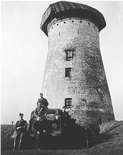
Historische Aufnahme der Alpen-Bönninghardter Turmwindmühle aus der Zeit des Zweiten Weltkriegs