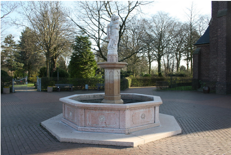
Marienbrunnen am Vorplatz der Wallfahrtskirche St. Mariä in Marienbaum, Xanten (2017).