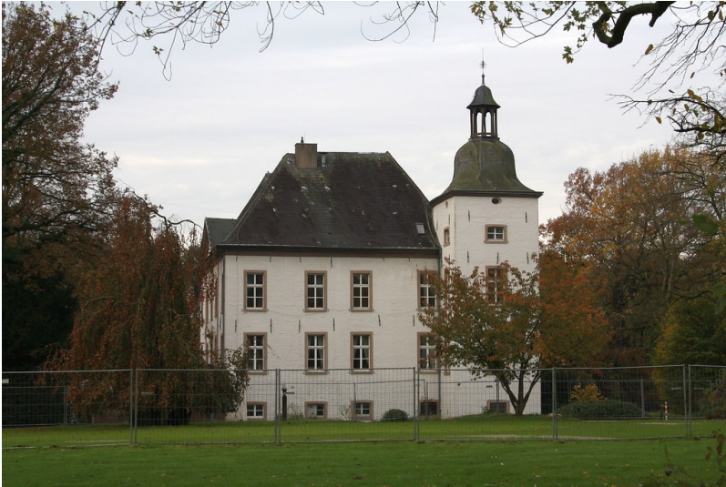
Wassergartenhaus Voerde an der Allee in Voerde (2014).