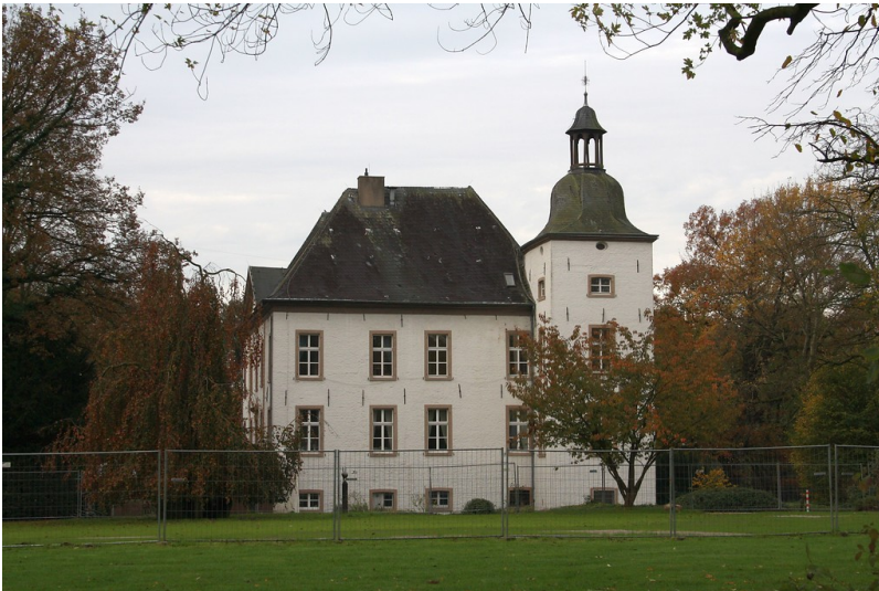
Wasserburg Haus Voerde an der Allee in Voerde (2014).