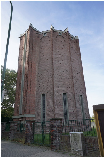
Wasserturm in Frillendorf (2018)