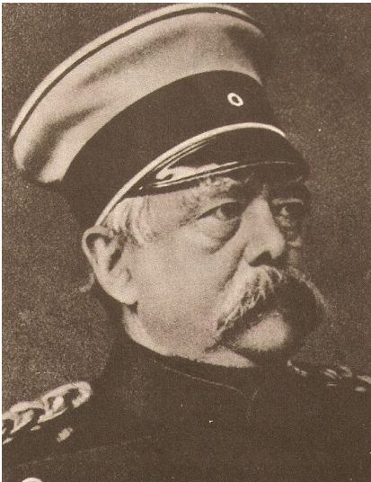
Historische Fotografie von 1877: Brustbild-Portrait des Reichskanzlers Otto von Bismarck (1815-1898).