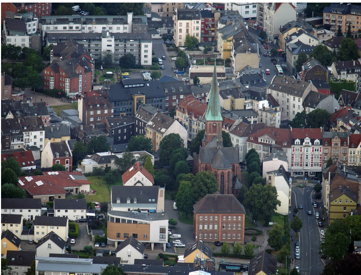
Katholische Jakobuskirche in Breckerfeld (2021)