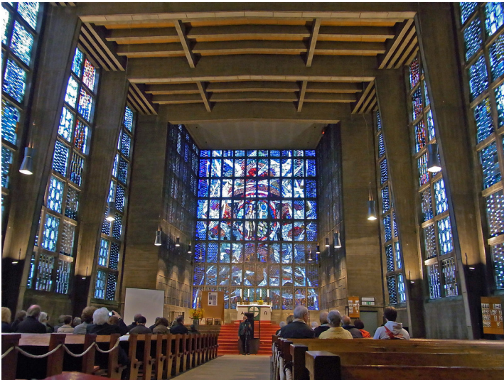
Innenansicht der St. Nicolai-Kirche in Dortmund (2013).