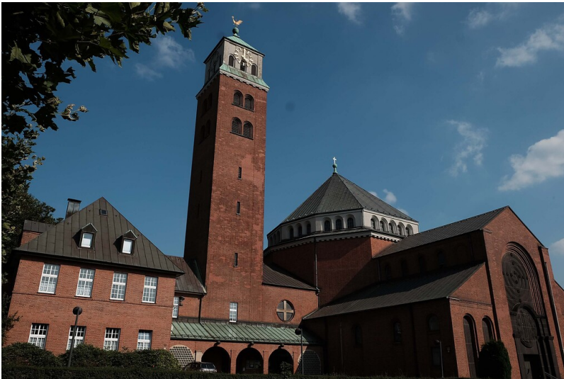
Die Heilig Kreuz Kirche in Gladbeck-Butendorf (2021)