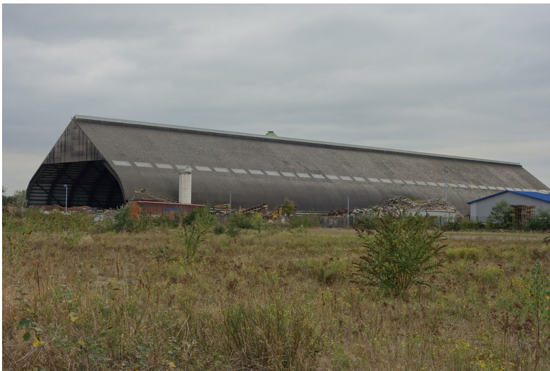
Rohkohlenmischhalle Pattberg (2016)