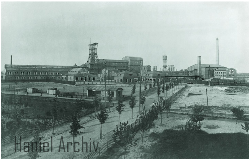
Steinkohlenbergwerk Rheinpreußen, Schachanlage V bei Moers nach 1900.