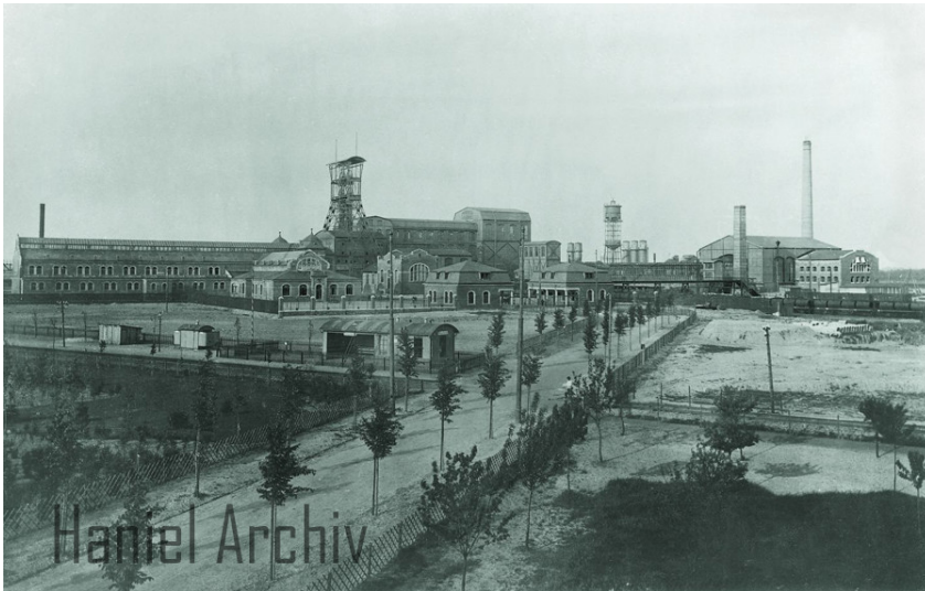
Steinkohlenbergwerk Rheinpreußen, Schachtanlage V bei Moers nach 1900.