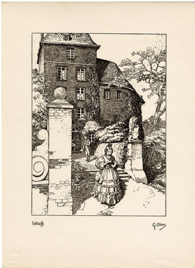
Heimatbilder "Aus einer niederrheinischen Kleinstadt", Federzeichnungen von Gustav Olms, Text von Edmund Renard erschienen 1921. Hier: Moers Fotograf/Urheber: Gustav Olms; Edmund Renard