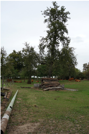
Weidefläche bei Haus Frohnenbruch, Kamp-Lintfort (2016)