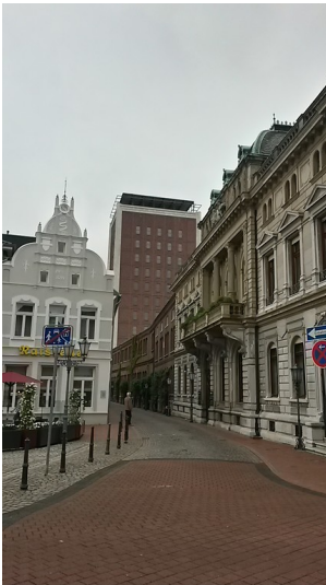
Blick in die Unterbergstraße in Rheinberg mit dem Stammhaus der Firma Underberg (2016).