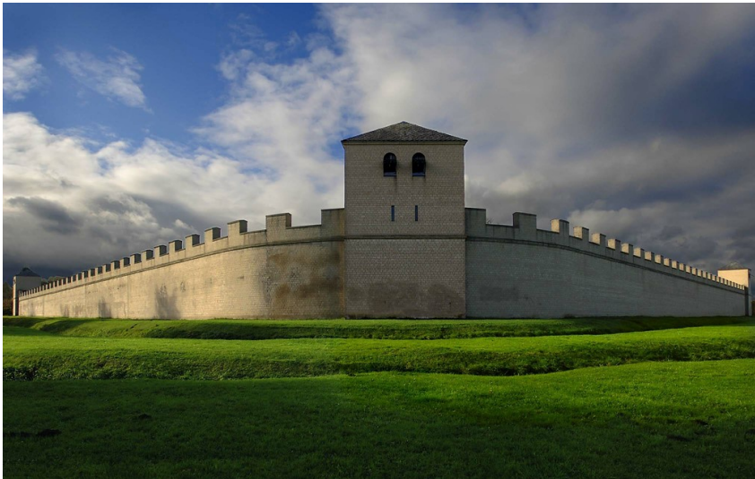
Die rekonstruierte römische Stadtmauer im LVR-Archäologischen Park Xanten (2011).