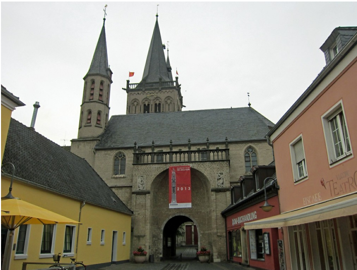
Südöstlicher Zugang zum Immunitätsbereich des ehemaligen Viktorstifts, des Kollegiatstifts St. Viktor in Xanten (2013)