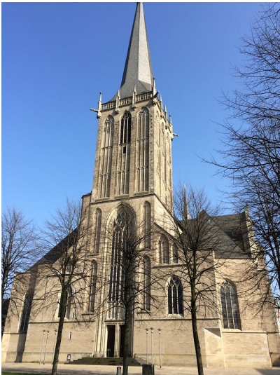
Die Frontansicht des Willibrord-Doms auf dem Großen Markt in Wesel