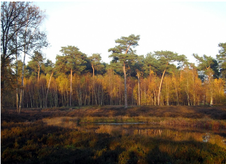
Heidelandschaft und Wald in der Dingdener Heide (2011).