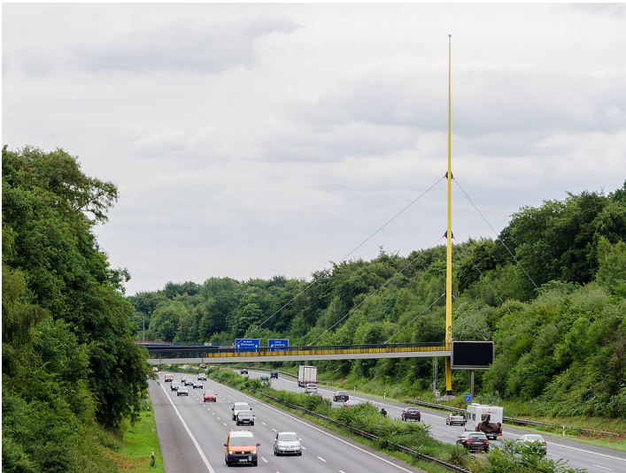
Die Expo-Brücke an der Bundesautobahn A3 entlang des Duisburger Stadtwaldes (2015).