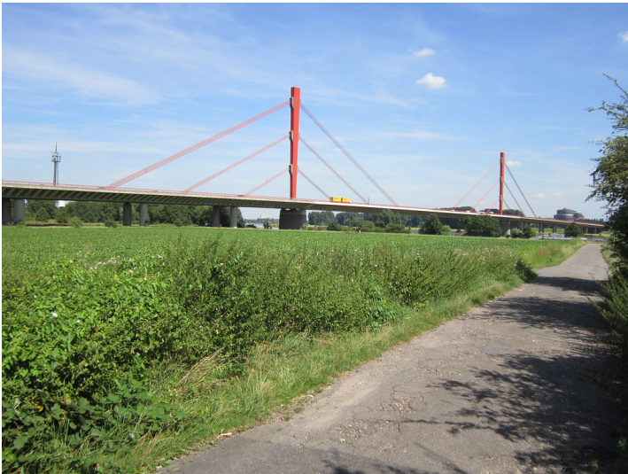
Die Beeckerwerther Brücke zwischen Duisburg-Baerl und -Beeckerwerth, Blick nach Norden (2012).