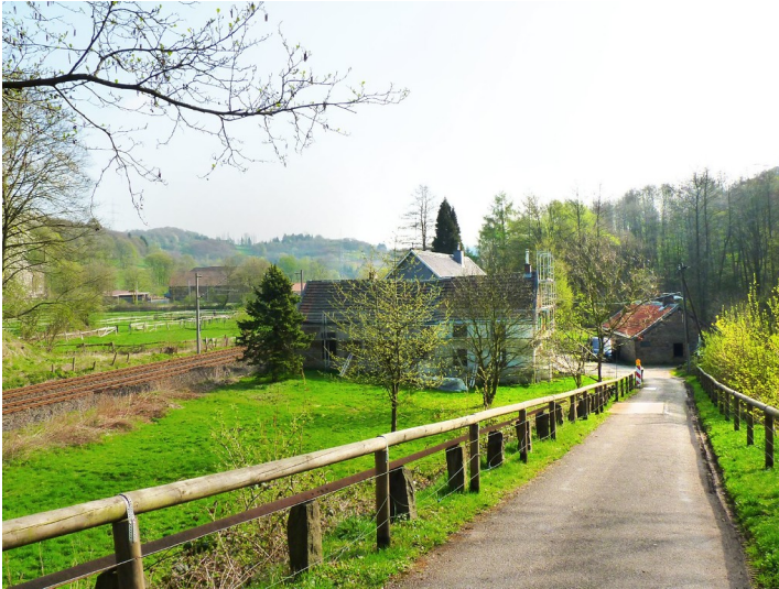
Das Gebäude des Dampfhammers im Deilbachtal (2011)