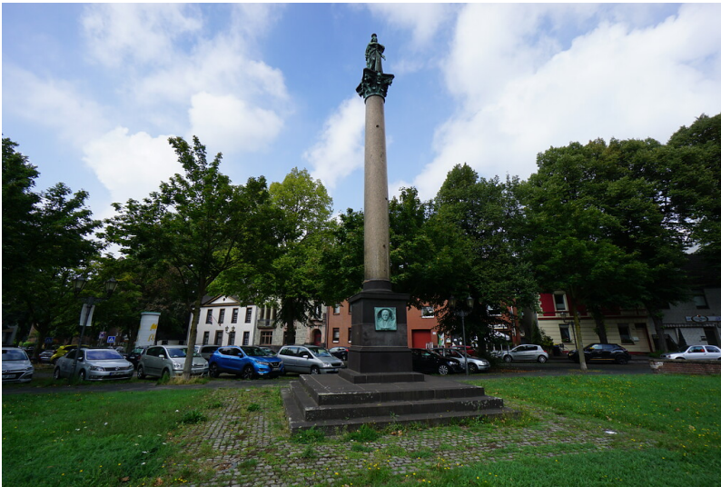
Die Vicksensäule steht auf einem getreppten Sockel in einer Rasenfläche auf einem zentralen Platz in Ruhrort (2020).