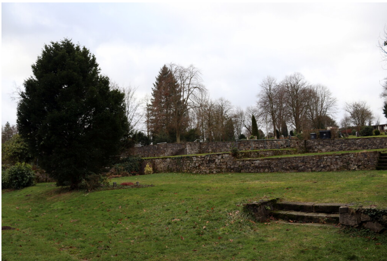
Gemauerte Terrassen auf dem Terrassenfriedhof in Essen (2024).