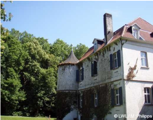
2008: Haus Goldschmieding

Haus Goldschmieding in Castrop-Rauxel