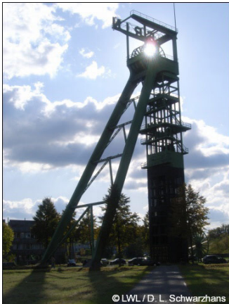
Einzelobjekt 5 Fördergerüst „Erin VII“ (Foto 2009): Das Fördergerüst für den Schacht „Erin VII“ ist eines der wenigen Bauwerke, die hier heute noch an den Standort der Zeche Erin erinnern. Die Konstruktion ist inzwischen zum Merkmal und zugleich zur Landmarke für den „Dienstleistungs- und Gewerbetpark Erin“ geworden.

Zeche Erin in Castrop-Rauxel (2009)