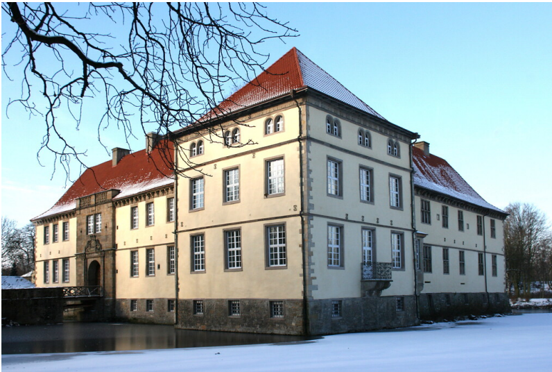
Das Schloss Strünkede in Herne-Baukau (2010)