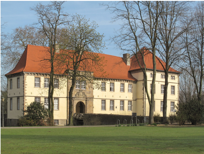
Das Schloss Strünkede in Herne-Baukau (2012)