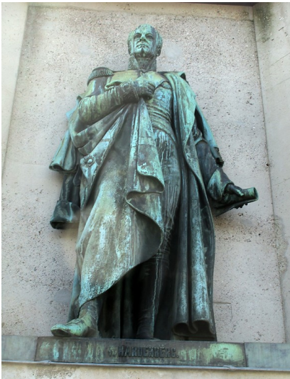
Sockelfigur auf dem Reiterstandbild auf dem Kölner Heumarkt: Fürst von Hardenberg (2018).