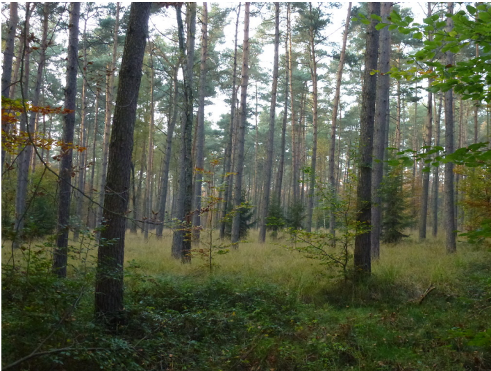
Etwa 90-jähriger Kiefernbestand im Dämmerwald (2012)