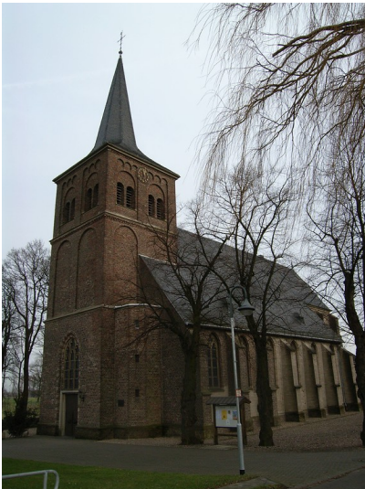
Katholische Kirche St. Johannes in Bislich (2008)