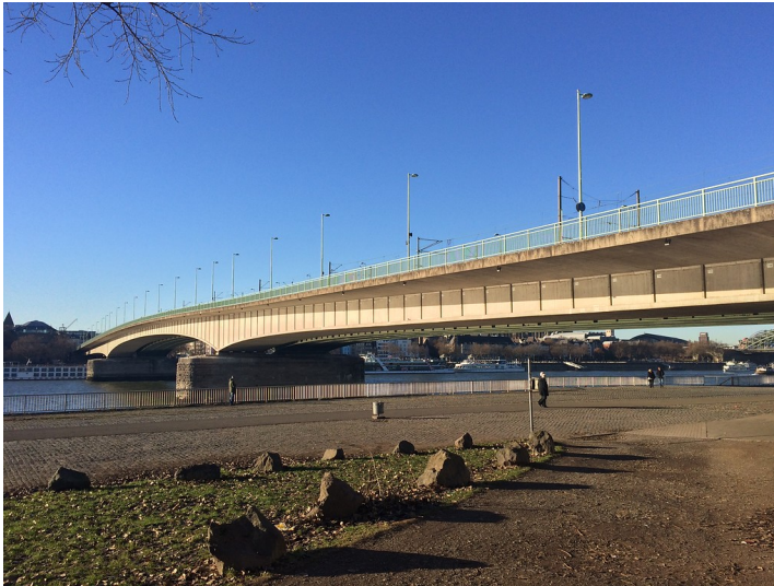
Blick auf die Deutzer Brücke in Köln (2016)