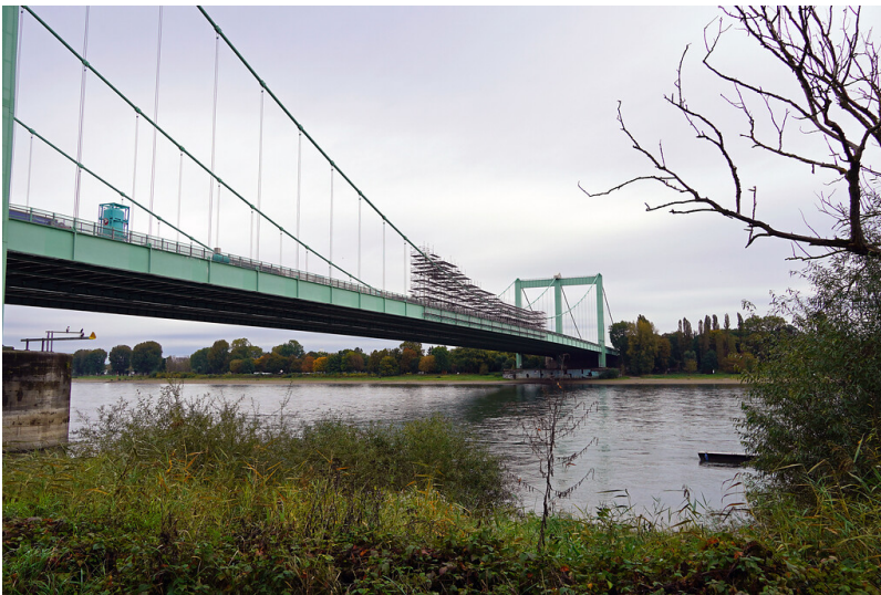
Blick auf die Rodenkirchener Autobahnbrücke mit Baugerüst in Köln-Rodenkirchen (2021).