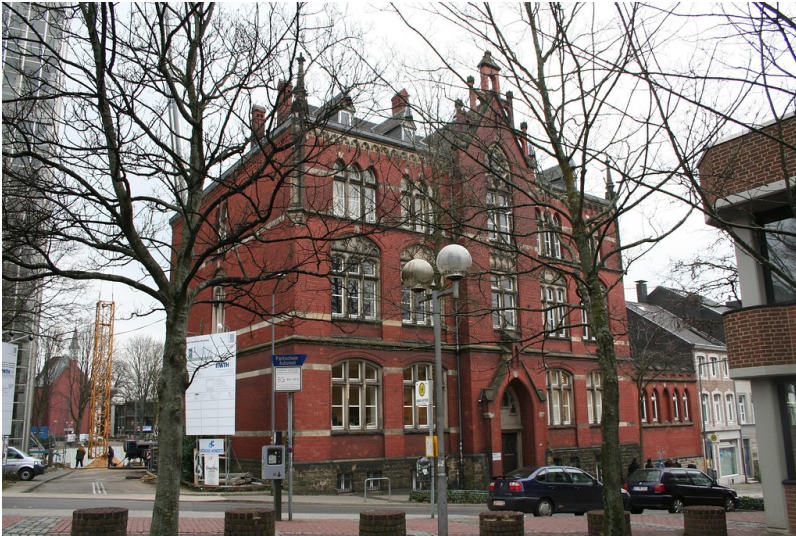
RWTH Aachen, Philosophisches Institut (ehemalige Mädchenrealschule), Eilfschornsteinstraße 14 (2011).