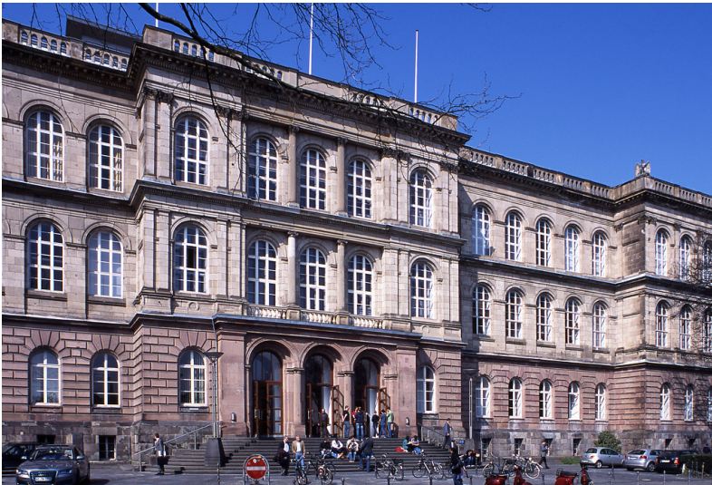
RWTH Hauptgebäude, Templergraben 55