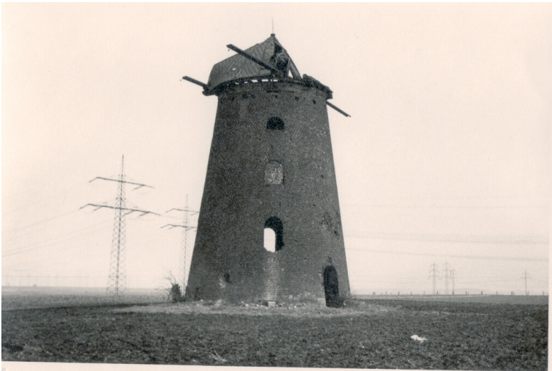
Oberaußemer Mühle (Ende der 1950er Jahre)