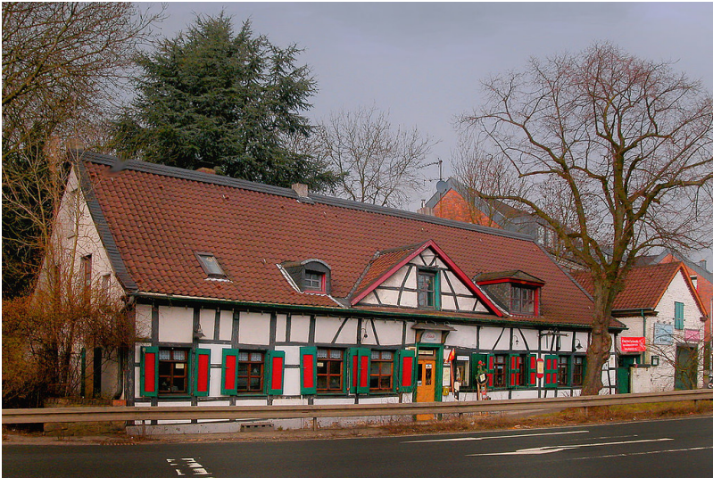
Das Fachwerkgebäude des Kulturzentrums Fünte (Funte), Gracht 209 in Mülheim-Heißen (2013).