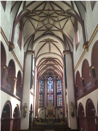
Hauptchor der Koblenzer Liebfrauenkirche (2013)