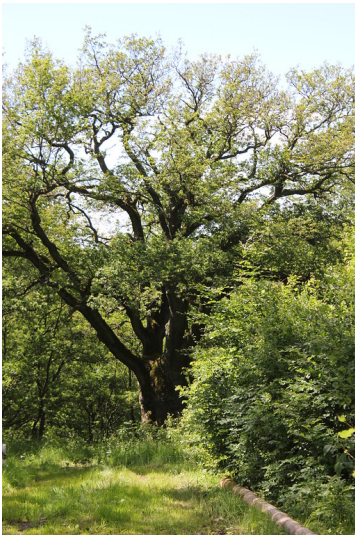
Die alte Eiche in Kelberg-Zermüllen im Frühsommer 2012.