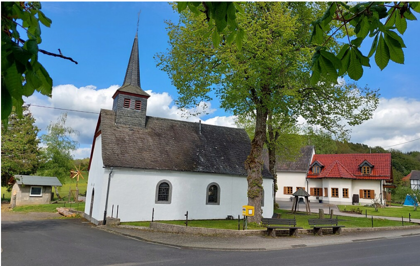
Blick auf die St. Matthiaskapelle im Straßendorf Köttelbach, ein Ortsteil von Kelberg im Landkreis Vulkaneifel (2021).