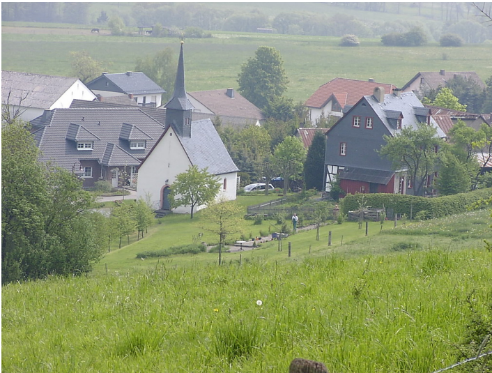
Meisenthal mit Kapelle und Pfarrhaus (2004)