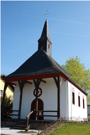
Die Kapelle St. Maria Magdalena in Kelberg-Hünerbach (2011).