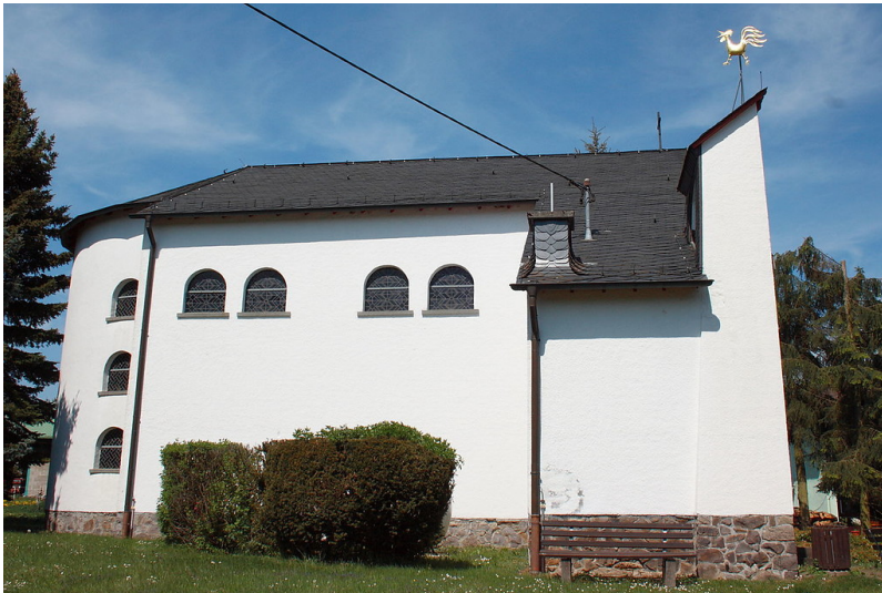
Die katholische Kapelle St. Donatus in Kelberg-Zermüllen (2011).