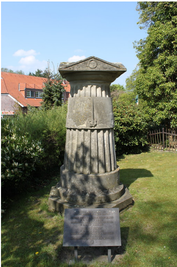
Turmförmiges Grabmal von 1820 für die Besitzer des Hauses Gahlen auf dem alten Friedhof "De Widow" mit einer kleinen Bronzetafel davor (2014).