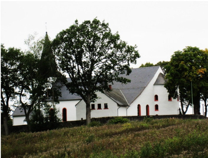
Pfarrkirche St. Hubert Hilgerath in Neichen (2019)