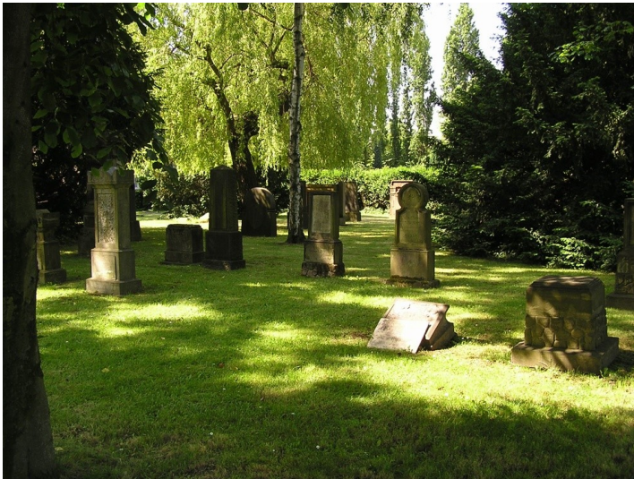
Gräber auf dem Jüdischen Friedhof in Beeck-Stockum in Duisburg (2005)