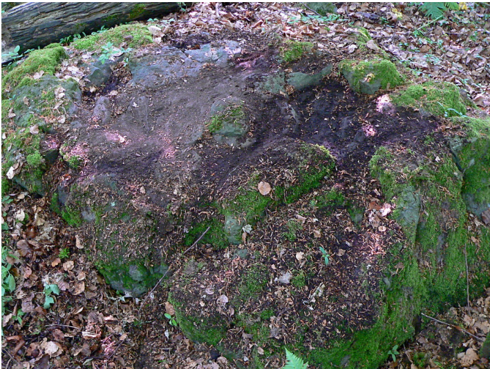
Der ehemalige Opferstein der keltischen Ringwallanlage auf dem Barsberg bei Bongard (2008).