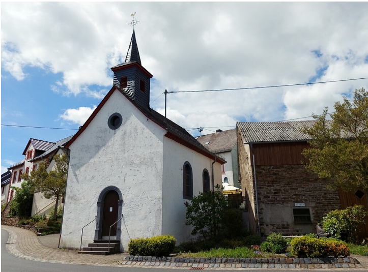
Die St. Antoniuskapelle im Straßendorf Sassen im Landkreis Vulkaneifel (2021).