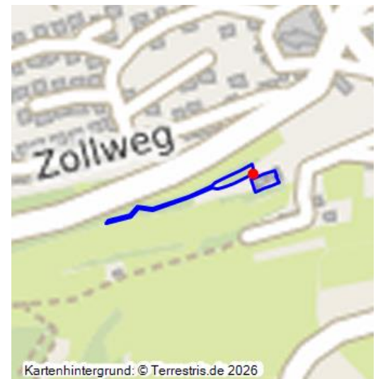
Informationstafel, Geschichtsstraße Abschnitt 1: Route Uersfeld-Gunderath, Station 18 Dreese Mühle.

Die Dreesemühle wurde 1622 in einer Kellerei-Rechnung der Grafschaft Virneburg erstmals erwähnt. Die Mühle war bis 1957 in Betrieb und wurde mit dem Wasser des Uersfelder Baches angetrieben. Sie hieß früher auch Schimmelsmühle. Der Name „Dreese“ leitet sich vermutlich von der letzten Müllerfamilie Dreis ab. Die Erwähnung in der Kellerei-Rechnung der Grafschaft Virneburg hängt damit zusammen, dass Virneburg Güterbesitz im kurkölnischen Schultheißenamt Uersfeld-Uess hatte. Damals lieferte der Müller zu Uersfeld jährlich eine Gans von „der Mühle daselbst“ nach Virneburg vom Wasserlauf; desgleichen 1626/27.